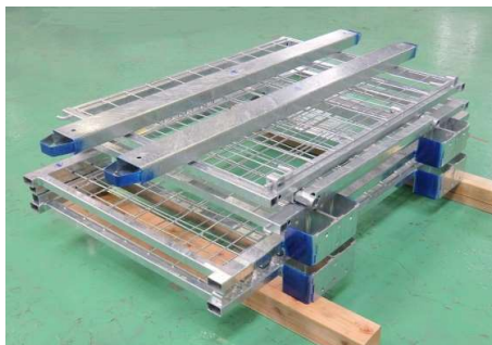
折りたたみ保管時