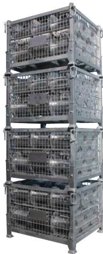
使用時の段積み4段