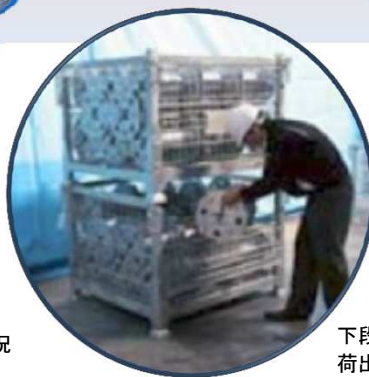
下段パレットの 荷出し入れ状況