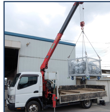
ユニック吊り状況