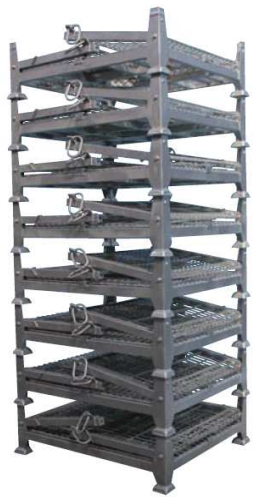
折り畳み時の8段積み