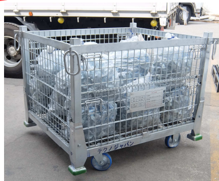
下車輪を付ければ手押しで移動可能