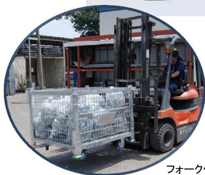
フォーク作業状況